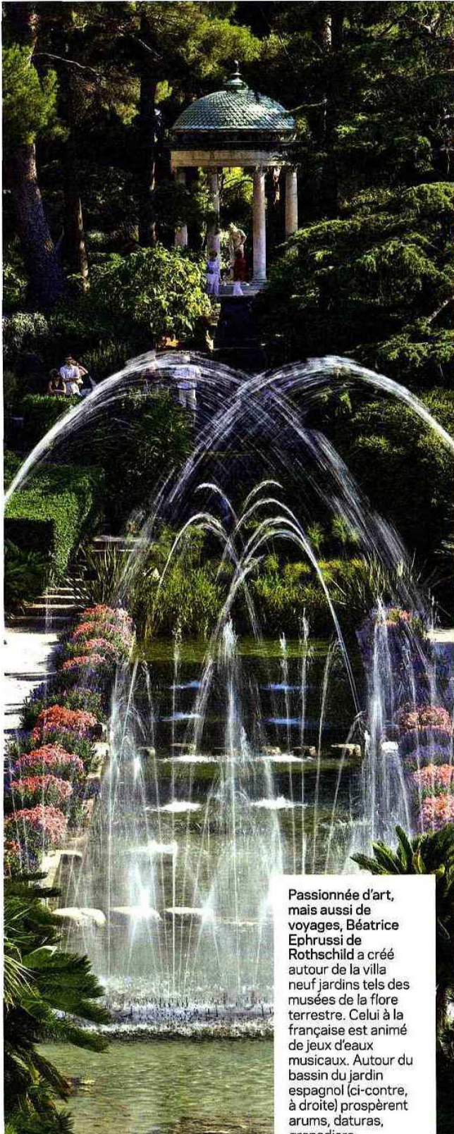
Passionnée d'art, mais aussi de voyages, Béatrice Ephrussi de Rothschild a créé autour de la villa neuf jardins tels des musées de la flore terrestre. Celui à la française est animé de jeux d'eaux musicaux. Autour du bassin du jardin espagnol (ci-contre, à droite) prospèrent arums, daturas, anémones.